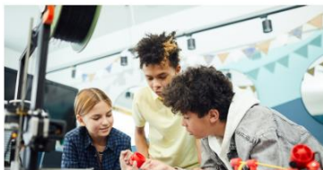
ÜBER DIE MINT-REGION

MINT steht für Mathematik, Informatik, Naturwissenschaften und Technik. In Workshops und Mitmach-Angeboten für Kinder und Jugendliche, widmen wir uns mit Spaß und Neugier den verschiedenen MINT-Themen. Ob Umweltschutz, Digitalisierung oder 3D-Druck: Die Angebote laden dazu ein, MINT ganz praktisch zu erleben, selbst zu experimentieren und gemeinsam mit anderen an MINT-Projekten zu arbeiten.