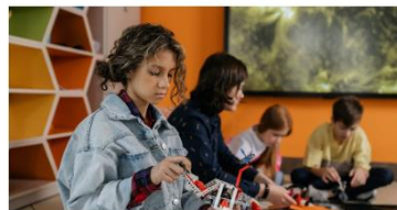
FÜR KINDER UND JUGENDLICHE